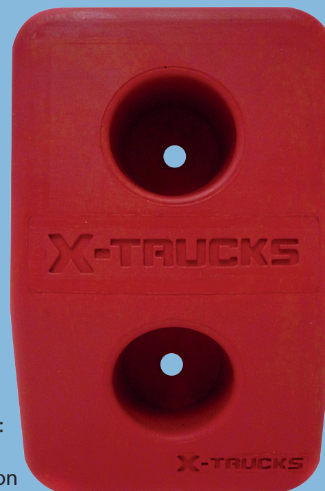
Tope Cuadrado C: Peso: 2.1 Kg Resistencia: 4 Ton