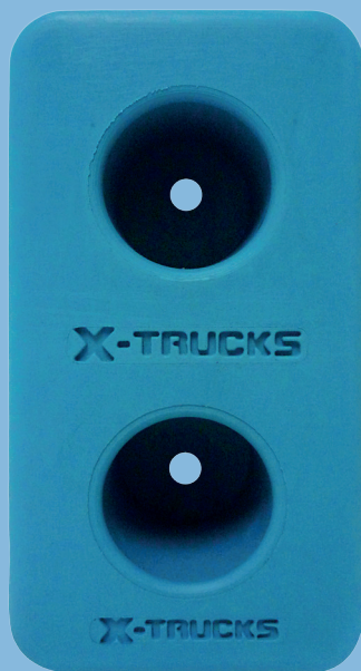
Tope Cuadrado A: Peso: 1.2 Kg Resistencia: 2 Ton