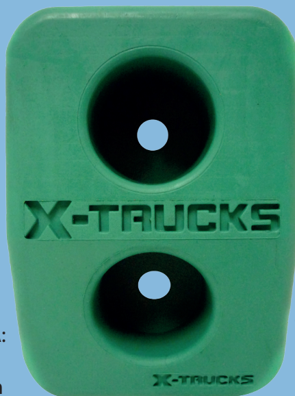
Tope Cuadrado B: Peso: 1.3 Kg Resistencia: 2.5 Ton